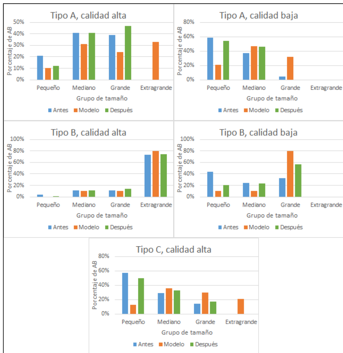
Figura 2: Distribuciones de AB por grupos de tamaño de los rodales de ejemplo de cada tipo de situación inicial, antes y después de las actuaciones y las correspondientes a los modelos de referencia.

La Figura 2 muestra la comparación de las distribuciones de AB por grupos de tamaño de los rodales de ejemplo correspondientes a antes de la actuación, al modelo de referencia y a después de la actuación. Las diferencias observadas entre la situación posterior a la actuación y el modelo de referencia indican que las intervenciones diseñadas corresponden a la fase de adaptación de la masa al modelo. Es previsible, pues, la necesidad de al menos una intervención más para aproximarse a los modelos de gestión referencia.