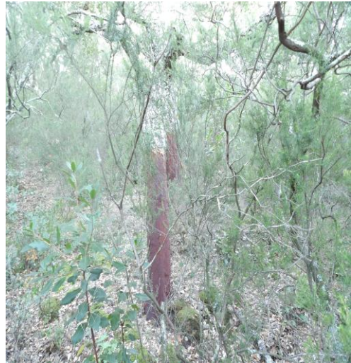
Finca: Can Gatets Municipi: Darnius Comarca: Alt Empordà Actuació LIFE + SUBER B1.2 - Qualitat d'estació baixa